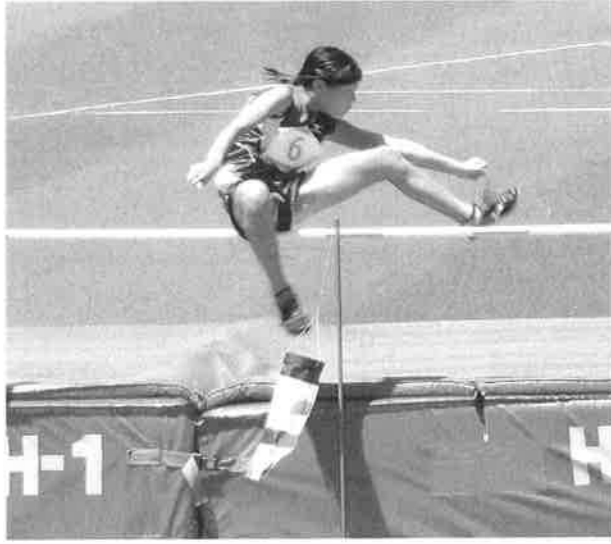
全国小学生陸上競技交流大会(神奈川県・日産スタジアム)